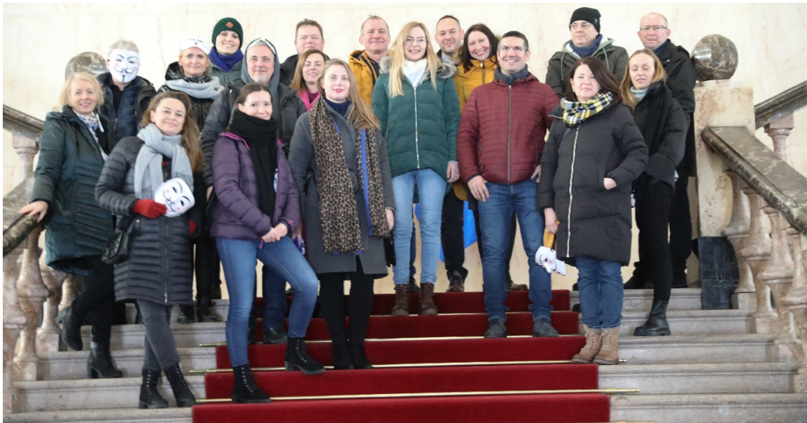
Muzeum Górnictwa Węglowego w Zabrze